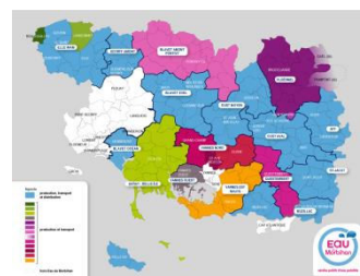
224 communes adhérentes en Production Transport et 113 communes adhérentes en Distribution (en bleu)

La population desservie est de 215 539 habitants .